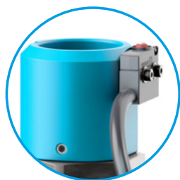
Unité de contrôle présence pièce avec capteur